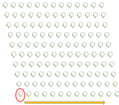
Fig. 4. Diagrama de cuadro a inspeccionar, iniciando en la fila 1, planta 1

Al terminar con la planta 1 se debe continuar con la inspección caminando por la entrefila en la misma dirección y se inspecciona la cuarta planta de la fila y así sucesivamente hasta terminar la fila, para continuar en la cuarta fila (Figura 5).