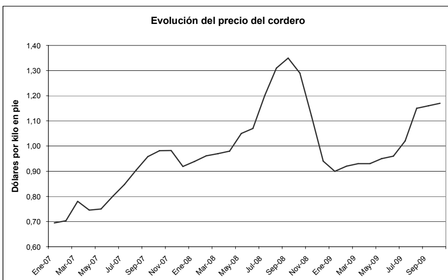
Grafica 2. Evolución del precio del cordero

Los precios al productor de los ovinos mostraron durante el año 2009 una tendencia creciente, luego de la fuerte caída ocurrida sobre mediados del segundo semestre del año 2008. En el mes de octubre de 2009, el precio del cordero pesado se ubicaba en un nivel muy similar al de octubre de 2008 (2,45 dólares por kilo en gancho), pero importa destacar que a octubre de 2009 ya el precio del cordero había registrado una fuerte reducción. Durante prácticamente todo este año 2009 el precio del cordero estuvo en promedio un 18% a 20% por debajo de un año atrás, previo a los efectos de la crisis.